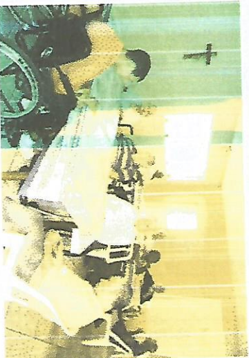
Aniversário do mês – 24/10/2017