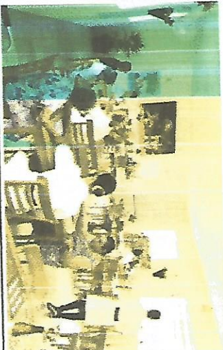
Dinâmica – 16/10/2017