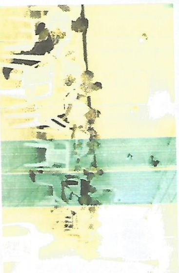
CCTI – Terra das Garças – 26/10/2017