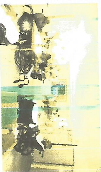
Projeto Festa da Fada Blue – 11/10/2017