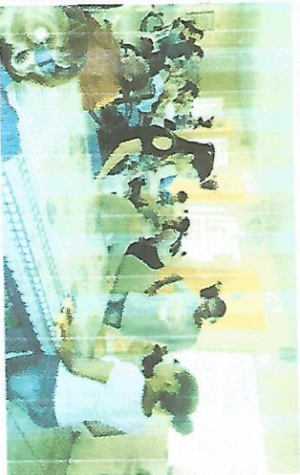
Projeto Bingo – 13/10/2017