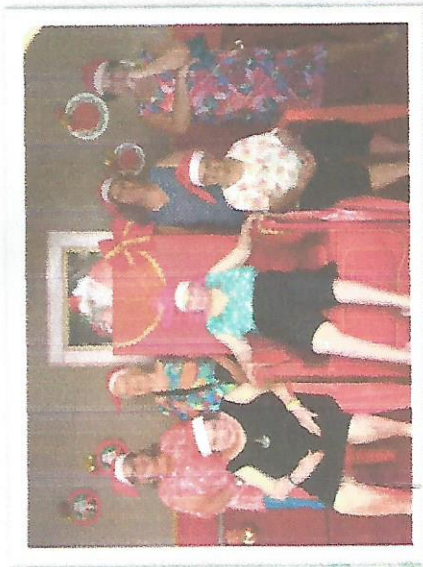
Passeio Praça Cons. Rois. Alves – 17/12/2018