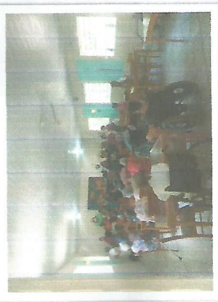
Apresentação do Coral da FEG – 12/12/2018