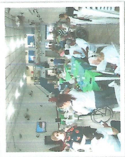
Encontro Geracional CCTI – 05/12/2018