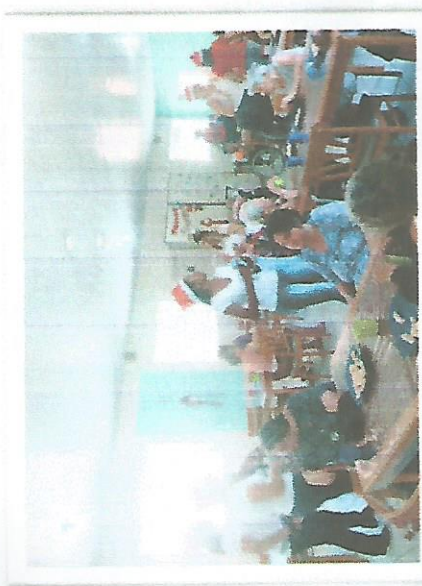
Apresentação da escola Musicando – 18/12/2018