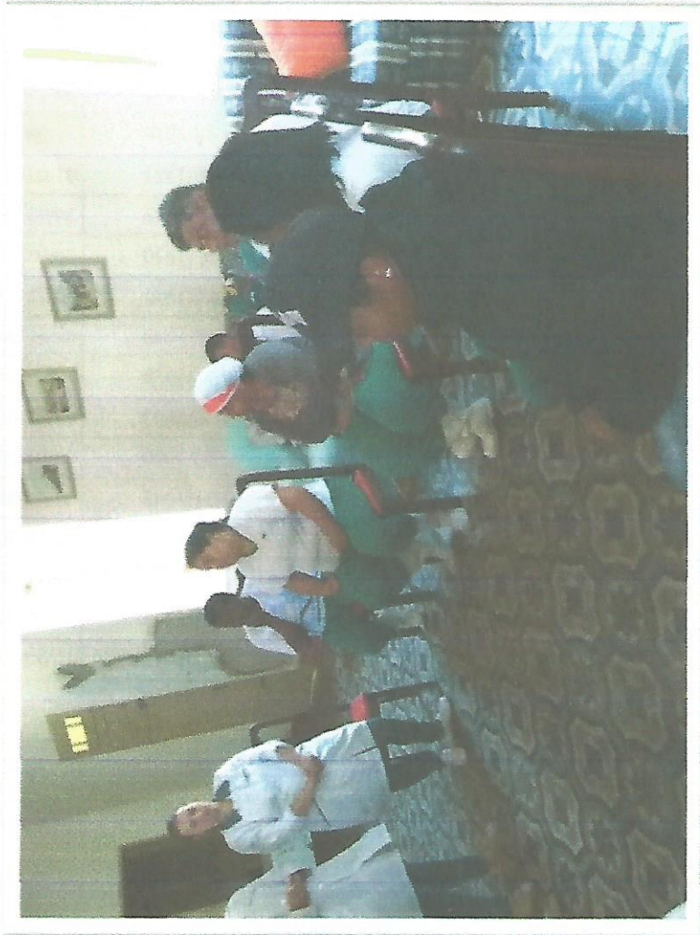
Palestra de capacitação –tema: Ética – 04/12/2018