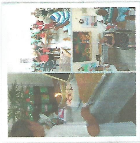
Aniversariante do mês – 28/12/2018