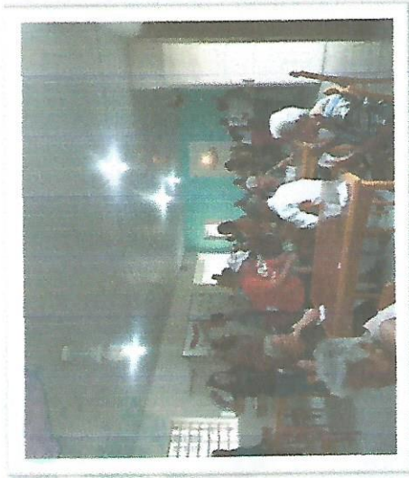
Apresentação do Grupo Alegria – 22/12/2018