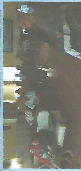
Dia do Cinema Dias 08, 22 e 29/11/18