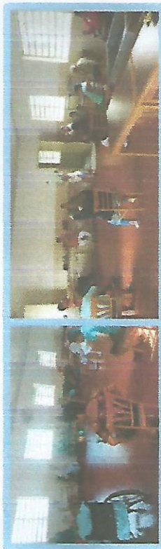
Atividade Física Dias 07 e 21.11.18