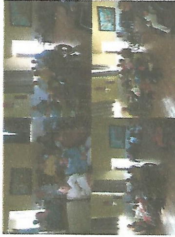
DIA DO CINEMA 06/09/2018 – 13/09/2018 – 20/09/2018