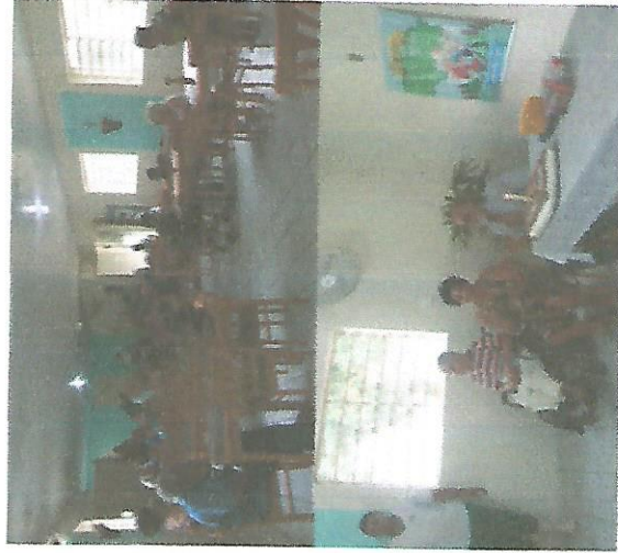
ANIVERSARIANTE DO MÊS 26/09/2018