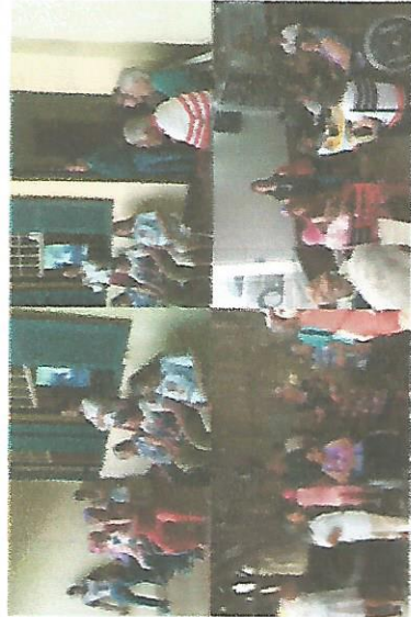
PASSEIO DO MUSEU 19/09/2018