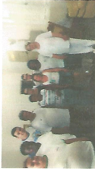
B. E. S. T ALLIANCE 05/09/2018