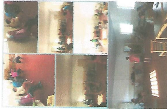
ATIVIDADE FÍSICA 19/09/2018 – 26/09/2018