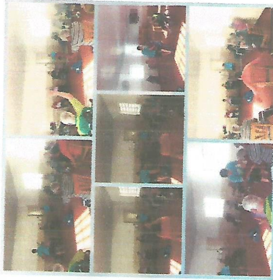
ATIVIDADE FÍSICA 01/08/2018 – 08/08/2018