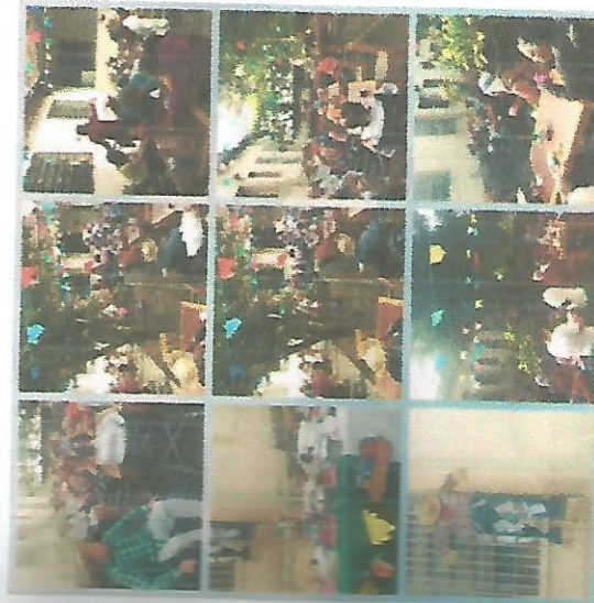
FESTA AGOSTINA 15/08/2018