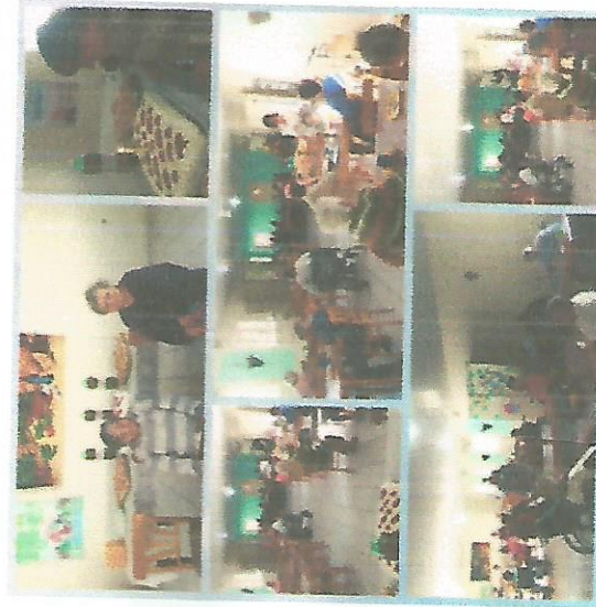
ANIVERSÁRIO DO MÊS 29/08/2018