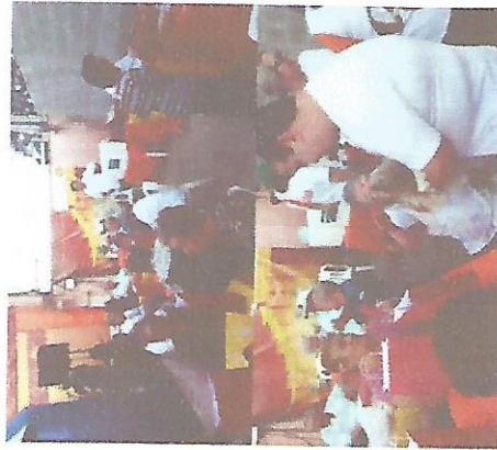
PASSEIO NO CLINICÃO 28/07/2018