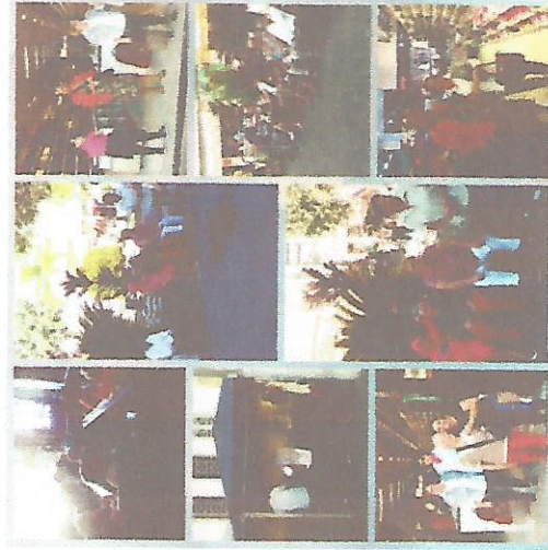
PASSEIO NA PRAÇA 18/07/2018