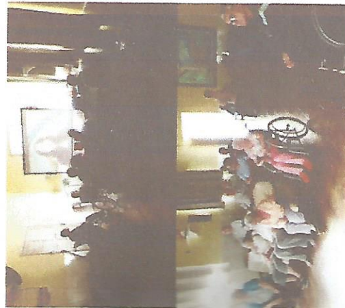
DIA DO CINEMA 05/07/2018 - 12/07/2018