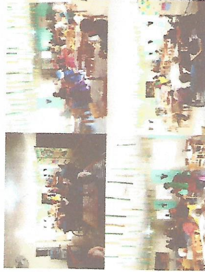
APRESENTAÇÃO GRUPO CERCI 19/07/2018