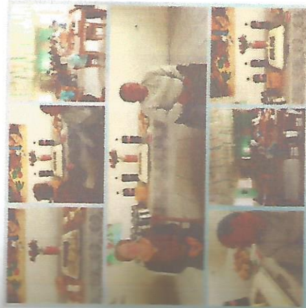
ANIVERSARIANTE DO MÊS 25/07/2018