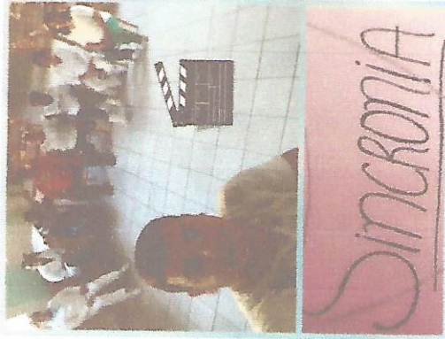
PALESTRA: TRABALHO EM EQUIPE E MOTIVAÇÃO. 20/07/2018