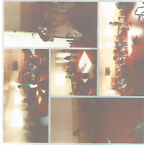
ATIVIDADE FÍSICA 11/07/2018 – 25/07/2018