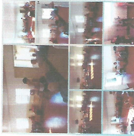
ATIVIDADE FÍSICA 06/06/2018 – 20/06/2018 – 27/06/2018