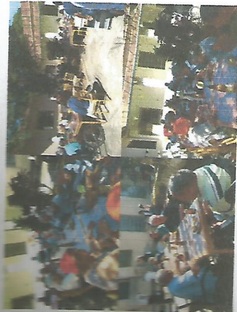
DIA DO CHURRASCO 28/06/2018