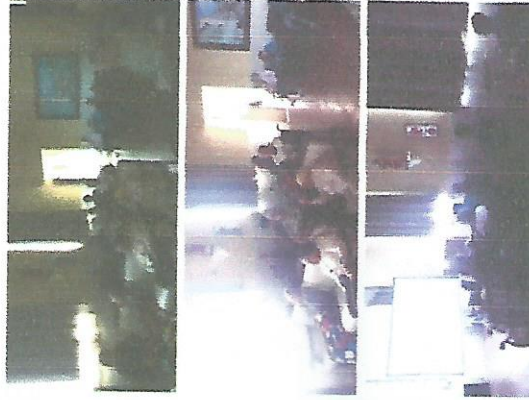
DIA DO CINEMA 07/06/2018 – 14/06/2018 – 21/06/2018 – 28/06/2018