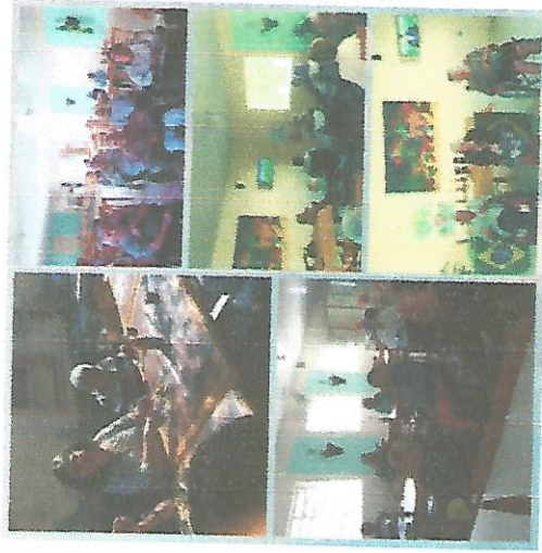
ANIVERSÁRIO DO MÊS 27/06/2018