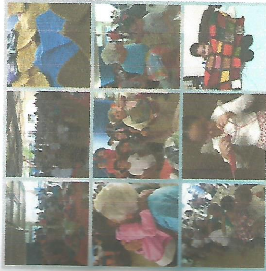
PASSEIO NA ESCOLA USEFAZ 11/06/2018