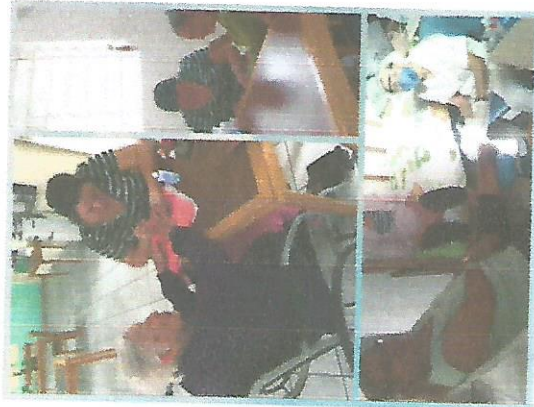
DIA DE BELEZA 28/06/2018