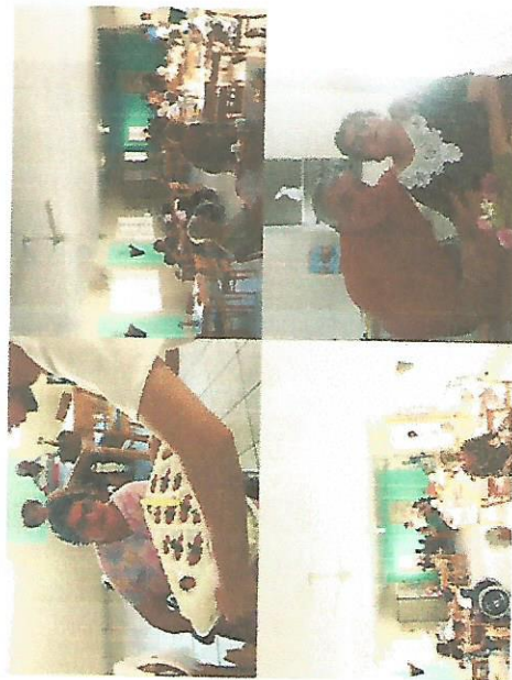
ANIVERSÁRIO DO MÊS 25/04/2018