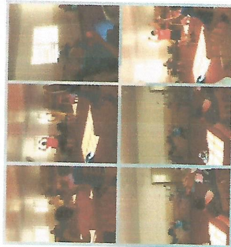
ATIVIDADE FÍSICA 04/04/2018 – 11/04/2018 – 25/04/2018