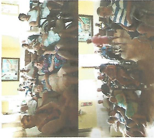
DIA DO CINEMA 05/04/2018 – 12/04/2018