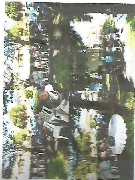
DIA DO PIQUENIQUE 19/04/2018