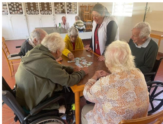
Meta 3.1 – Figura 04

Atividade Lúdica – realizada em 18/07/2024