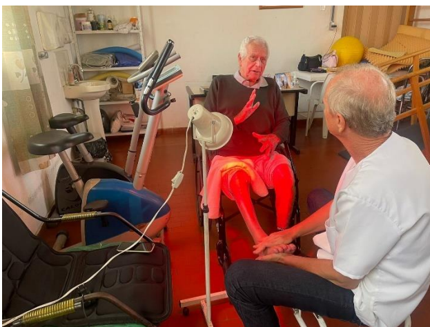
META 01: Figura 03- Massagem terapêutica Registro fotográfico dia 17/07/2024