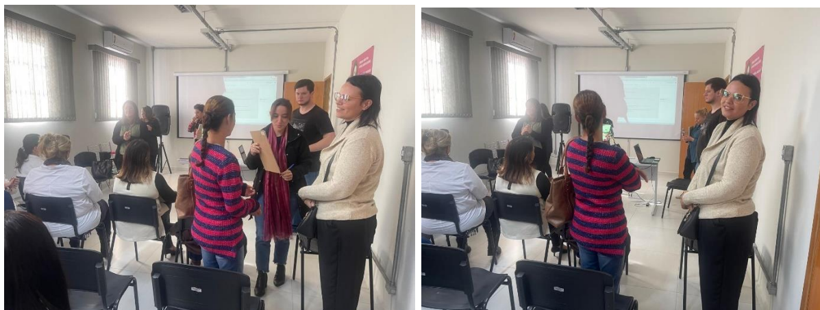
META 04 – FIGURA 01 e 02: Reunião – realizada em 05/07/2024