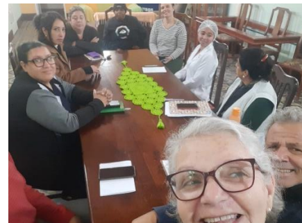
META 02: Figura 01,02 e 03 – Reunião de equipe – realizada dia 30/07/2024.