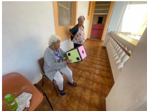
Meta 3.1 – Figura 02

Atividade Lúdica – realizada em 16/07/2024