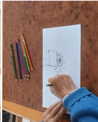
Meta 3.2 – Figura 01, 02 e 03 – Oficina de pintura – realizada em 04/07/2024