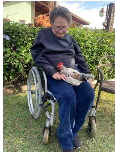
Meta 3.3 – Figura 03 e 04 – Passeio externo – realizado 11/07/2024