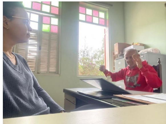
Meta 05 – Figura 02

Atendimento individual – realizado 02/07/2024