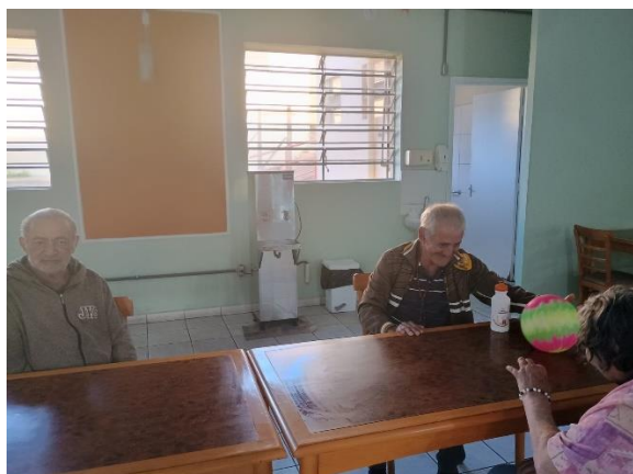
Meta 3.1 – Figura 03

Atividade Lúdica – realizada em 16/07/2024