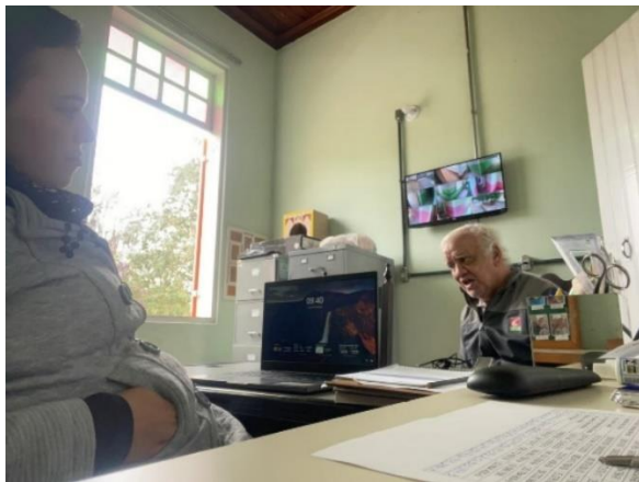
Meta 05 – Figura 01

Atendimento individual – realizado 02/07/2024