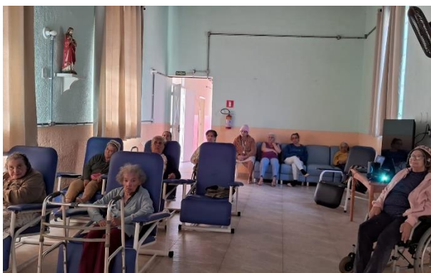
Meta 3.1 – Figura 01

Informo que antes de cada sessão de cinema, foram apresentadas 03 opções de filmes para os idosos escolherem qual mais os agrada. Após a exibição, foi aberto um espaço para comentários referente ao filme que acabaram de assistir e sugestões de gêneros para a próxima sessão que foi exibida na semana seguinte.