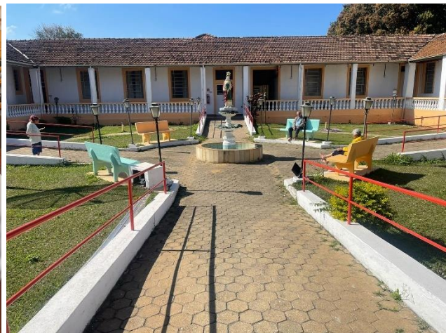
META 01: Figura 04 - Banho de Sol Registro fotográfico dia 31/07/2024