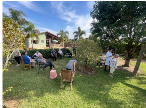
Meta 3.3 – Figura 01 e 02 – Passeio externo – realizado 11/07/2024