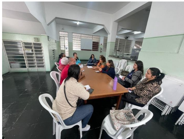
META 04 – FIGURA 02 e 03: Reunião do CMDPI – realizada em 05/06/2024