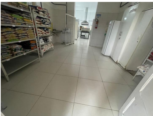
META 1 - Figura 03 Reforma: Troca de piso da cozinha – 25/06/2024