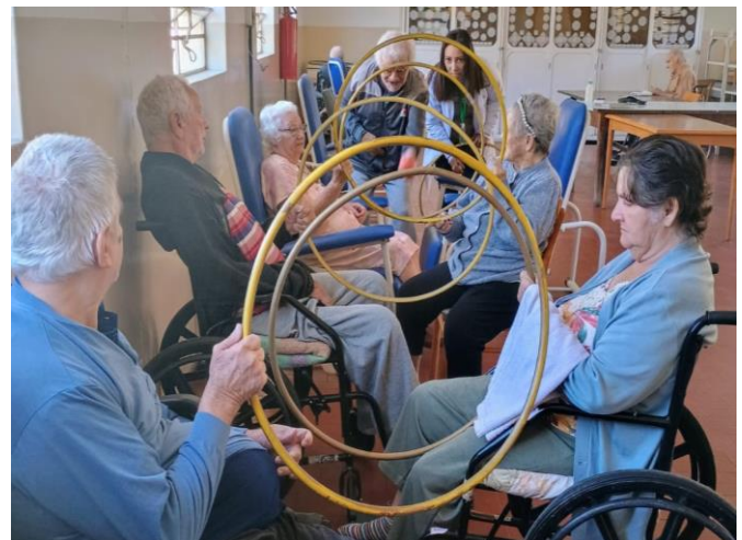
Meta 3.1 - Figura 02

Atividade Lúdica - realizada em 19/06/2024