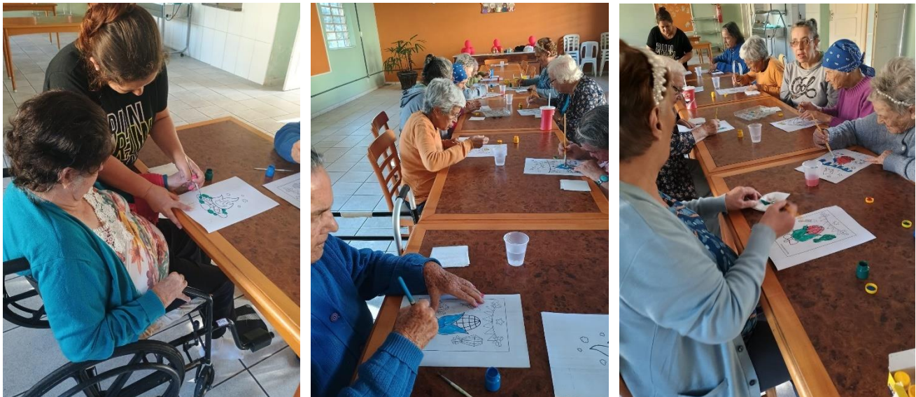
Meta 3.2 - Figura 01, 02 e 03 - Oficina de pintura - realizada em 06/06/2024

OBJETIVO ESPECÍFICO: Promover o acesso a programações culturais, de lazer, de esporte e ocupacionais internas e externas, relacionando-as a interesses, vivências, desejos e possibilidades do público, bem como a convivência mista entre os residentes de diversos graus de dependência.