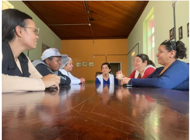
META 02: Reunião de equipe – realizada dia 26/06/2024.