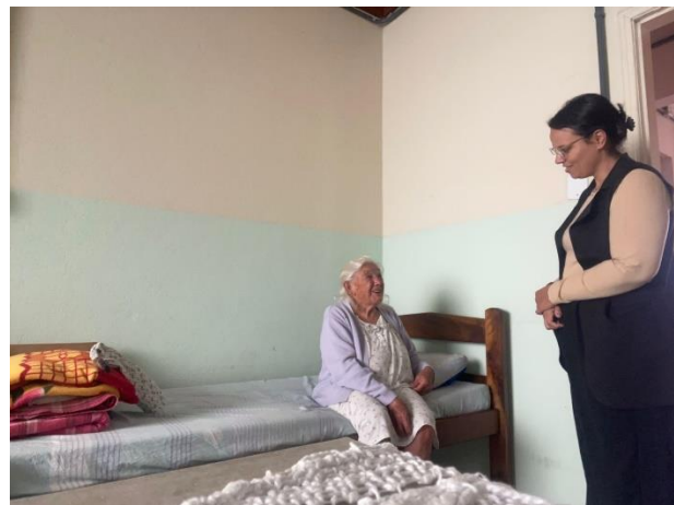
Meta 05 – Figura 02

Atendimento individual – realizado 10/06/2024