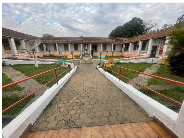
META 1 - Figura 04 Reforma: Pintura externa – 25/06/2024