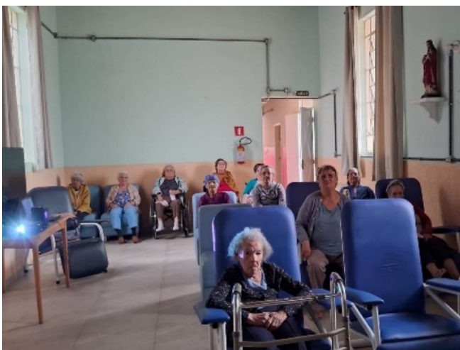
Meta 3.1 - Figura 01

Informo que antes de cada sessão de cinema, foi apresentada 03 opções de filmes para os idosos escolherem qual mais os agrada. Após a exibição, foi aberto um espaço para comentários referente ao filme que acabaram de assistir e sugestões de gêneros para a próxima sessão que foi exibida na semana seguinte.