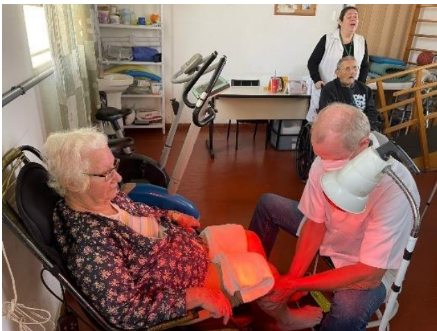
META 1 - Figura 01 Fisioterapia – 12/06/2024