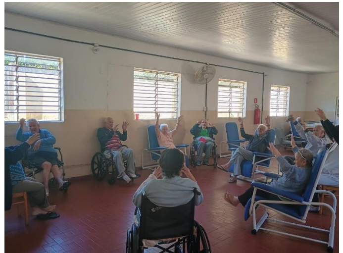
Meta 3.1 - Figura 04

Atividade Artística - realizada em 20/06/2024