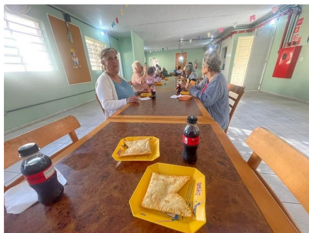
META 1 - Figura 02 Tarde do pastel – 17/06/2024