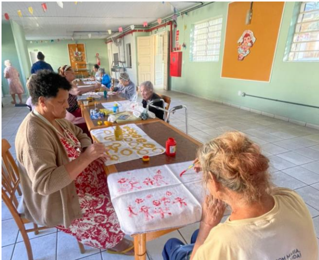
Meta 3.1 - Figura 03

Atividade Artística - realizada em 20/06/2024