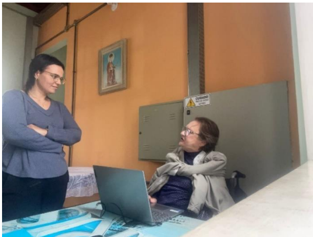
Meta 05 - Figura 01

Atendimento individual – realizado 10/06/2024