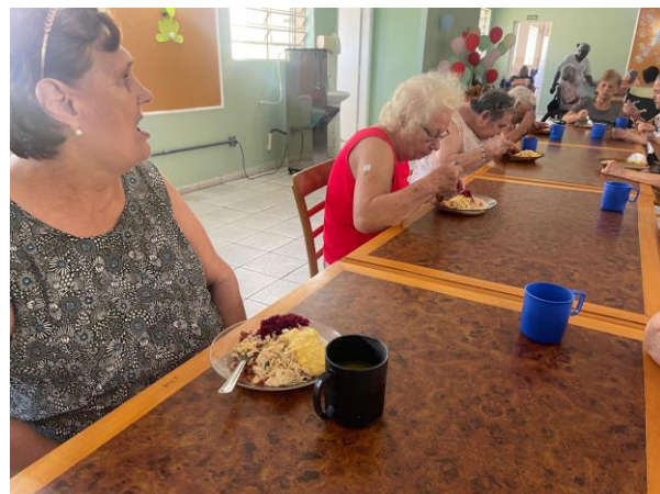
META 1 - Figura 04

Ação de carinho ao idosos Realizada em 15/14/2024