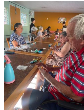
Meta 3.2 - Figura 01 e 02 - Oficina com massa de modelar - realizada em 25/04/2024