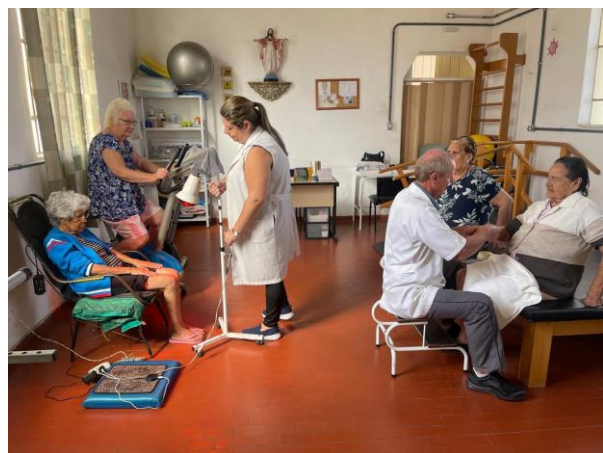
META 1 - Figura 02

Contato familiar através de ligação telefônica Realizada em 03/04/2024