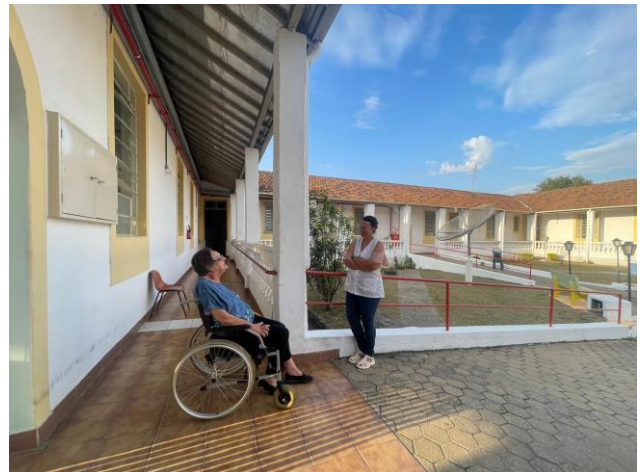
Meta 5 - Figura 02 - Escuta Social - realizada em 22/04/2024