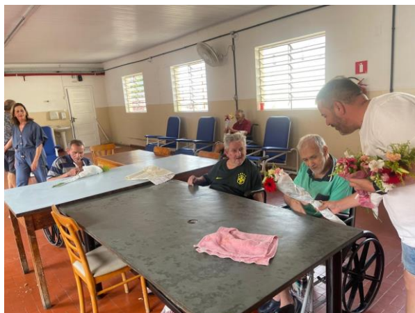
META 1 - Figura 03

Atendimento Fisioterapêutico e massagem terapêutica. Realizada em 12/04/2024