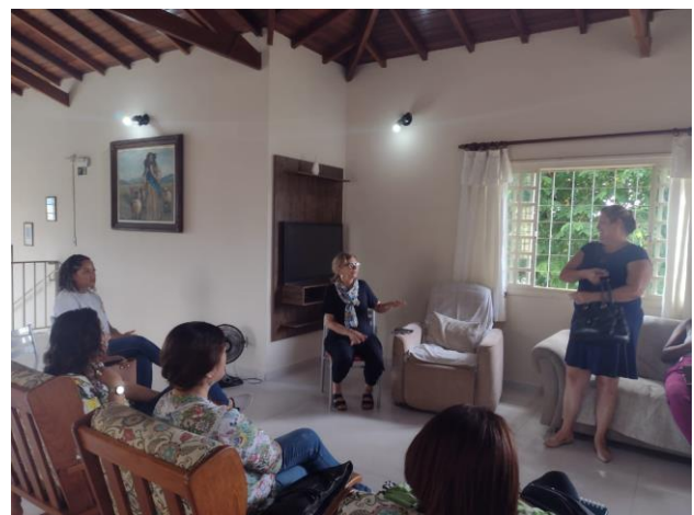
Figura 1 e 2 - Reunião do CMDPI - realizada em 10/04/2024