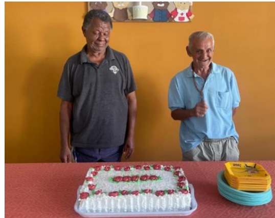
META 3 - ATIVIDADE CULTURAL - Festa dos aniversariantes - realizada em 25/04/2024

OBJETIVO ESPECÍFICO: Promover o acesso a programações culturais, de lazer, de esporte e ocupacionais internas e externas, relacionando-as a interesses, vivências, desejos e possibilidades do público, bem como a convivência mista entre os residentes de diversos graus de dependência.