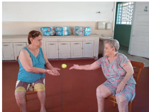
Meta 3.1 - Figura 02 Atividade Lúdica - realizada em 16/04/2024