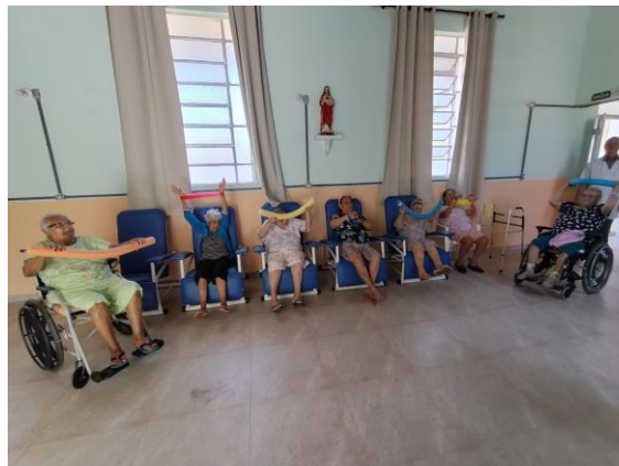
Meta 3.1 - Figura 04 Atividade física - realizada em 26/04/2024

OBJETIVO ESPECÍFICO: Promover o acesso a programações culturais, de lazer, de esporte e ocupacionais internas e externas, relacionando-as a interesses, vivências, desejos e possibilidades do público, bem como a convivência mista entre os residentes de diversos graus de dependência.