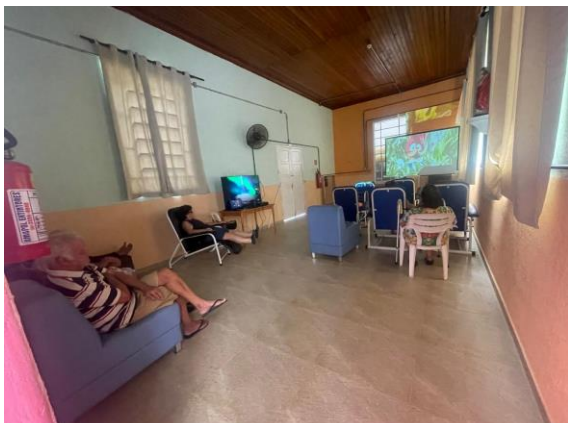
Meta 3.1 - Figura 03 Cinema- realizada em 23/04/2024