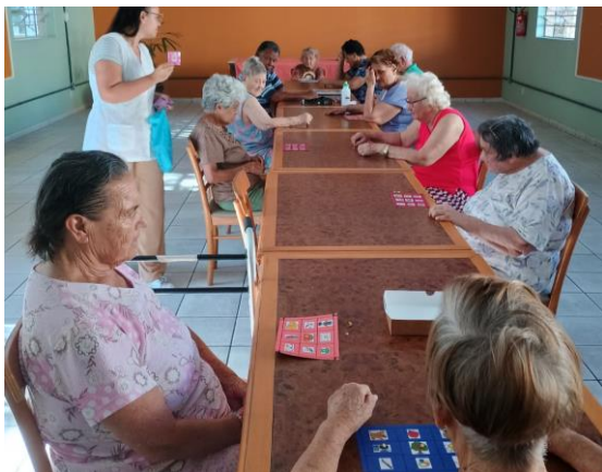
Meta 3.1 - Figura 01 Jogo - realizada em 09/04/2024