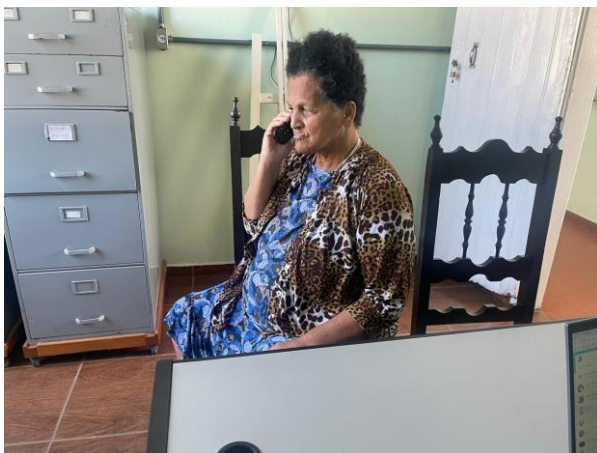
META 1 - Figura 01

Contato familiar através de ligação telefônica Realizada em 03/04/2024