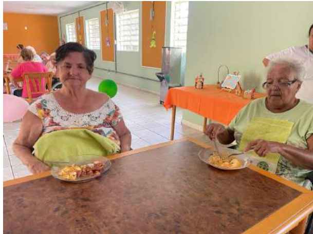
META 1- Figura 04 Alimentação - fotografada em 15/03/2024

OBJETIVO ESPECÍFICO: Qualificar a oferta do serviço por meio da promoção da capacitação sistemática dos profissionais responsáveis pela oferta dos serviços.