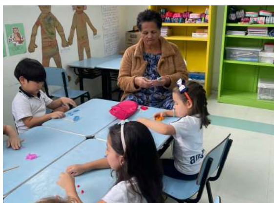
Figura 02 - Atividade com crianças