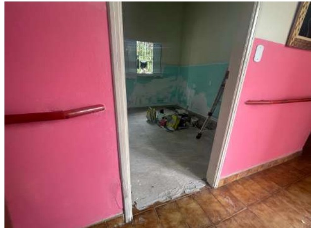
META 1 - Figura 02

Renovação do RG - fotografada em 05/03/2024