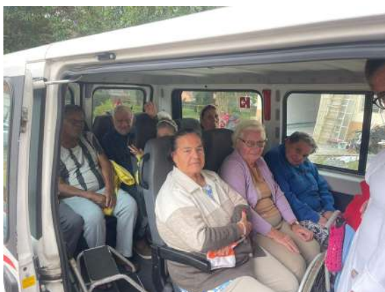
Figura 01 - Locomoção dos idosos

META 3.3 - Figuras 1,2,3 e 4 -PASSEIO EXTERNO - Visita ao colégio - realizada em 26/03/2024