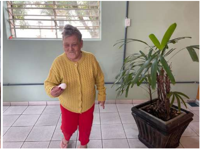
Meta 3.1 - Figura 04