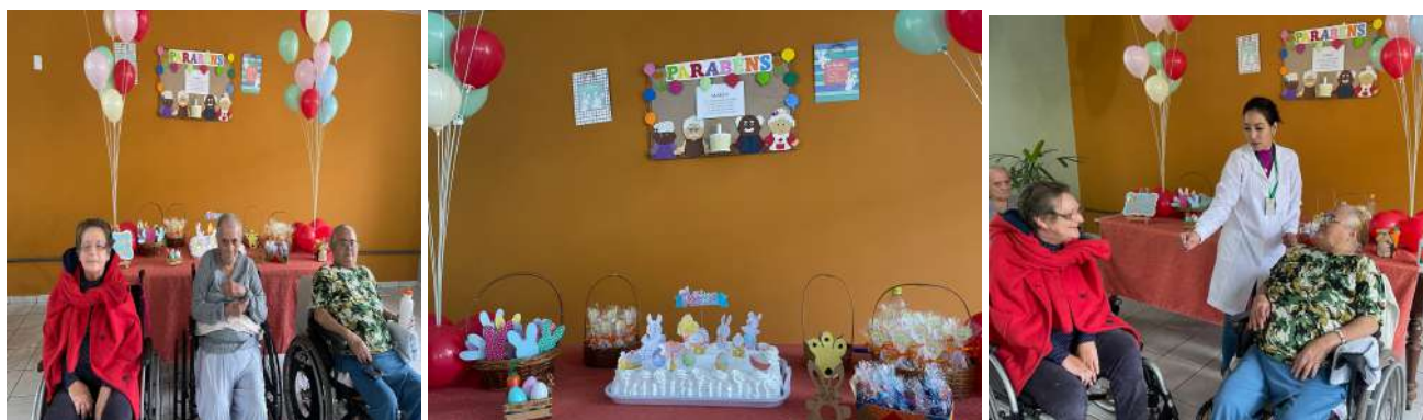
META 3 - ATIVIDADE CULTURAL - Festa dos aniversariantes - realizada em 28/03/2024

OBSERVAÇÕES: Na imagem abaixo mostra apenas 03 idosos aniversariantes frente a mesa do bolo, pois uma idosa por motivos de timidez, preferiu não participar e o outro idoso infelizmente faleceu.