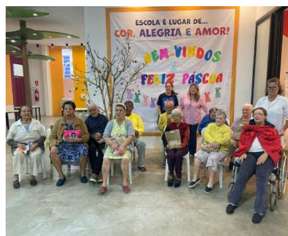
Figura 04 - Encerramento com doações