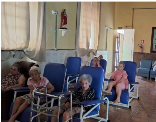
Meta 3.1 - Figura 01