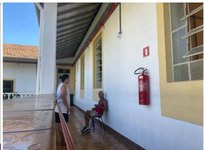
Meta 5 - Figura 02 - Escuta Social - realizada em 18/03/2024