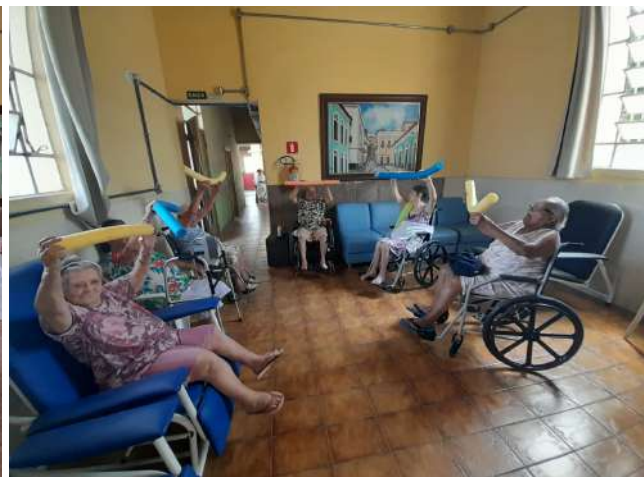
Meta 3.1 - Figura 02