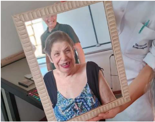
Meta 3.1 - Figura 03

Atividade Lúdica - realizada em 07/03/2024