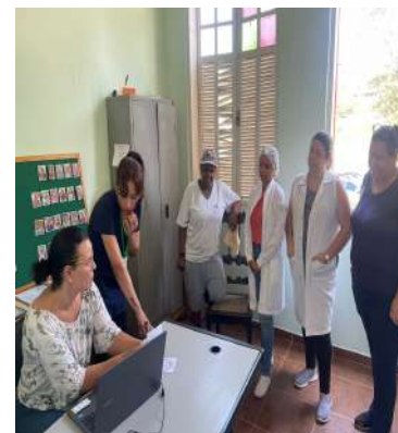
META 2 - Reunião de equipe - realizada em 20/03/2024