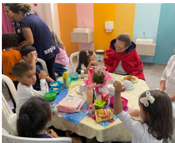
Figura 03 - Café da tarde com crianças