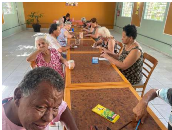
Meta 3.2 - Figura 01 e 02 - Oficina de páscoa - realizada em 21/03/2024