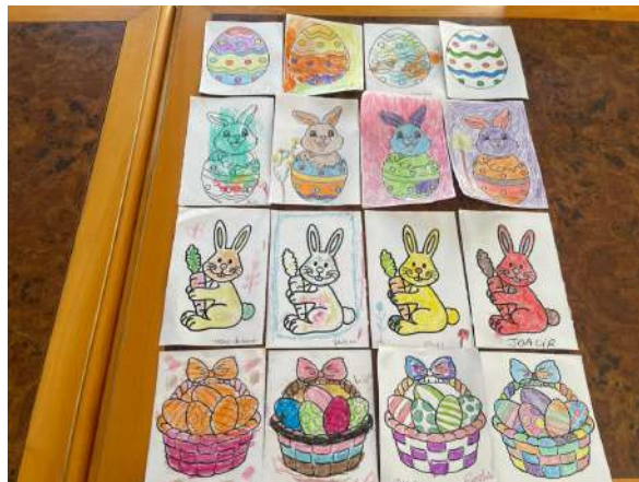
Meta 3.2 - Figura 03 e 04 - Oficina de páscoa - realizada em 21/03/2024