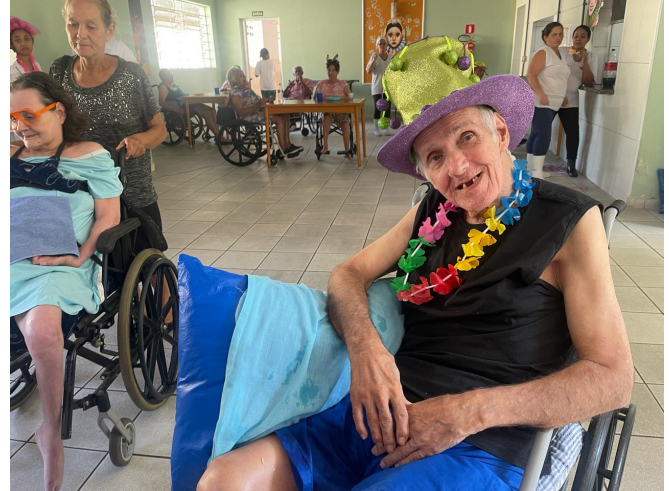
META 03: DATA 08/02/2024