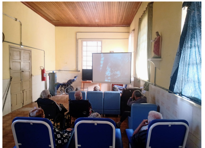
META 3.1: DATA 13/02/2024