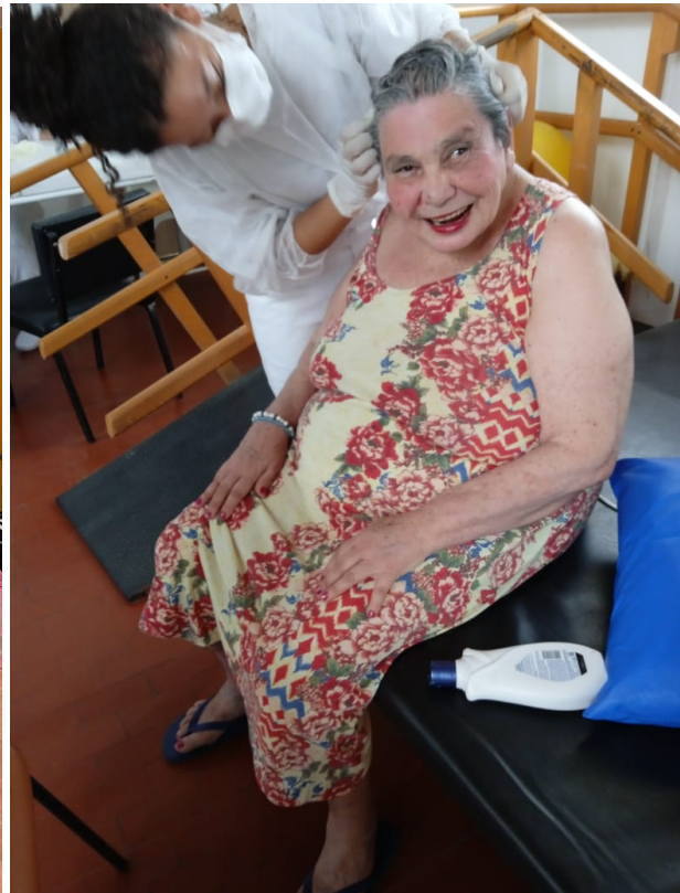
Imagens: Meta 01