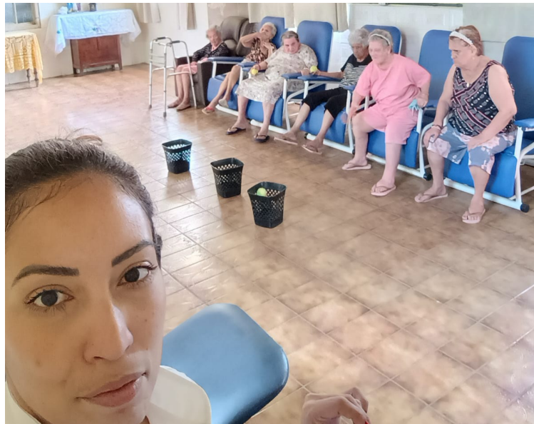
META 3.2: DATA 20/02/2024