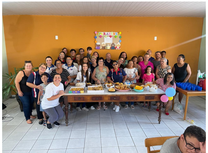
META 3.1: DATA 01/02/2024