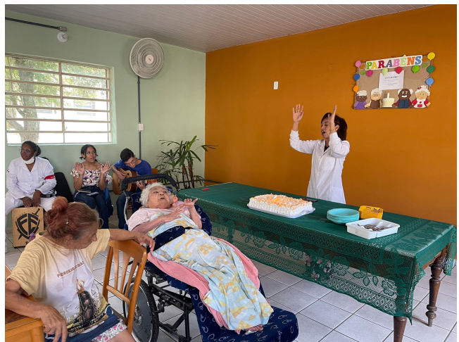
META 03: DATA 29/02/2024