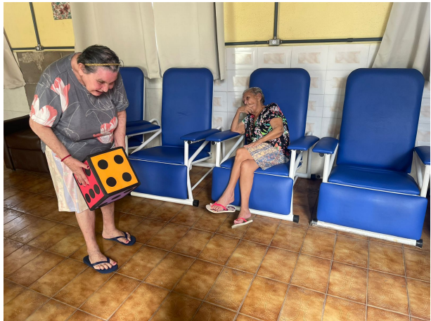
META 3.1: DATA 21/02/2024