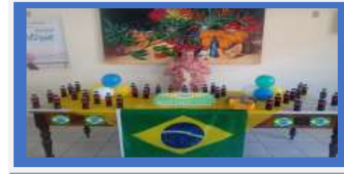
Dia:24 – Atividade Cultural – Comemoração Aniversariantes/ mes

OBJETIVO ESPECÍFICO: CONTRIBUIR PARA A ARTICULAÇÃO DA REDE SOCIOASSISTENCIAL, DOS DEMAIS ÓRGÃOS E DAS DEMAIS POLÍTICAS PÚBLICAS.