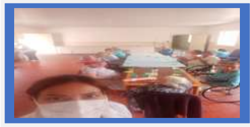
Dia: 16- Atividade Lúdica – Tema: Copa do Mundo