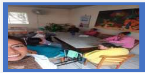
Dia:08 –Atividade Lúdica- Tema: Confeção de enfeites/Copa