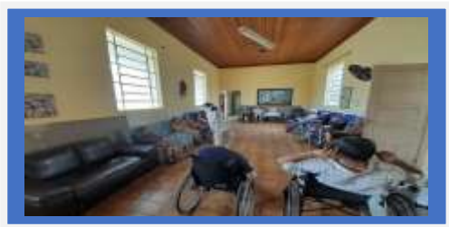
Dia: 18 Atividade Lúdica – Dinâmica: Falar nomes próprios