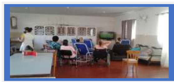
Dia:24 - Idosos assistindo o jogo da Copa

OBJETIVO ESPECÍFICO: QUALIFICAR A OFERTA DO SERVIÇO POR MEIO DA PROMOÇÃO DA CAPACITAÇÃO SISTEMÁTICA DOS PROFISSIONAIS RESPONSÁVEIS PELA OFERTA DO SERVIÇO.