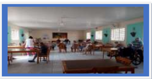
Dia:11 - Atividade Cultural – Música ao vivo

Observações: No evento do CCTI levamos poucos idosos, pois, estávamos com problema na OSC com funcionários.