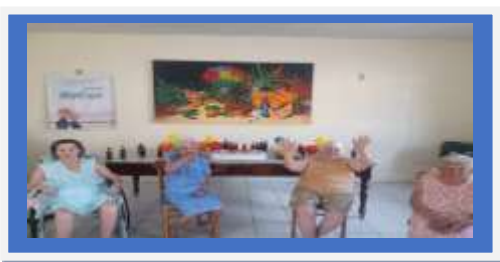
Dia: 27 Atividade Cultural comemorações/ Aniversariantes e Dia do Idoso