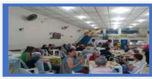
Dia:04 Atividade Cultural- Comemoração ao Dia do Idoso no CCTI