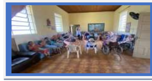
Dia:28 – Atividade Lúdica – Coordenada pela Fisioterapeuta