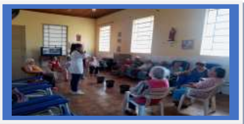
Dia:06- Atividade Lúdica – Acerte a cor e o cesto