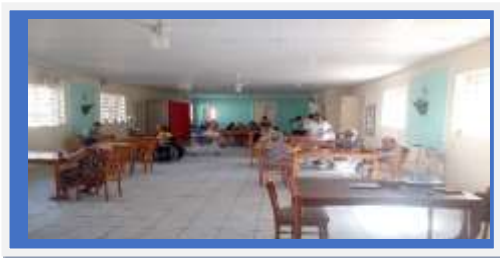
Dia: 27- Comemoração ao Dia do Idoso