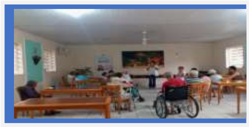
Dia: 24-Atividade Cultural- Roda de Conversa