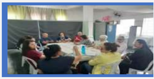
Dia: 05- Reunião CMDPI

OBJETIVO ESPECÍFICO: OPORTUNIZAR O ACESSO ÀS INFORMAÇÕES SOBRE DIREITOS E SOBRE A PARTICIPAÇÃO CIDADÃ, ESTIMULANDO O DESENVOLVIMENTO DO PROTAGONISMO DOS USUÁRIOS.