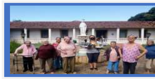
Dia 17 – Festa temática – entrega de ovo de Páscoa