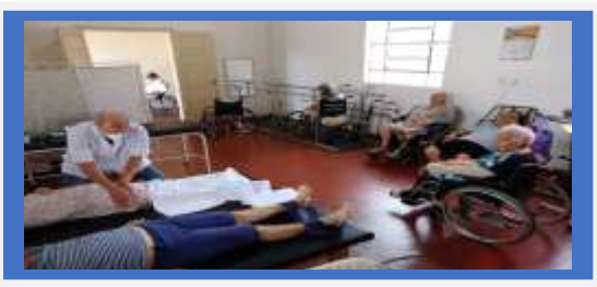
Fisioterapia 3x na semana