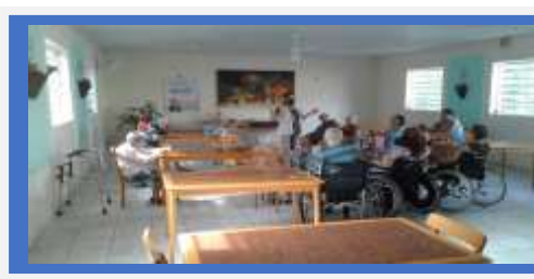
Dia: 11- Roda de conversa