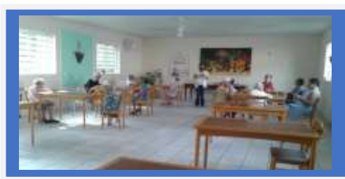
Dia: 12 – Atividade Lúdica – Jogo Lúdico