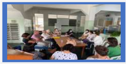
Dia 06 – Reunião CMDPI

Observações: Utilize esse campo para informações que julgar necessário e não se encaixam nos itens anteriores.