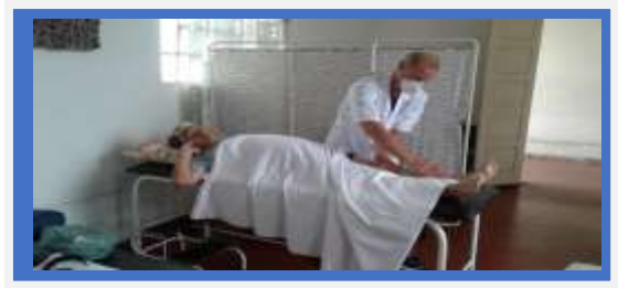
Massagem terapêutica e relaxante 3x na semana