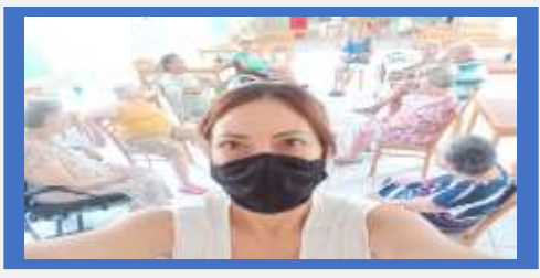
Dia: 20- Atividade Lúdica: – Oficina com a Psicóloga