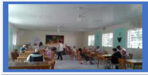
Dia: 18 - Atividade Lúdica- Jogo Lúdico