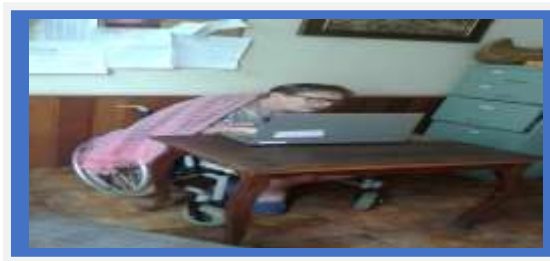
Idosa conversando com familiar através do notebook

OBJETIVO ESPECÍFICO: QUALIFICAR A OFERTA DO SERVIÇO POR MEIO DA PROMOÇÃO DA CAPACITAÇÃO SISTEMÁTICA DOS PROFISSIONAIS RESPONSÁVEIS PELA OFERTA DO SERVIÇO.