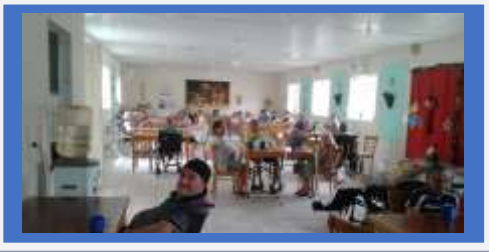
Dia :01- Festa Temática:Almoço 1º Dia do ano