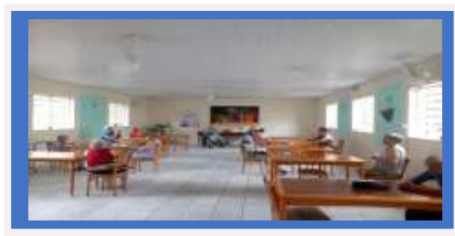
Dia: 27 –Atividade Cultural- Comemoração aniversariantes do mes