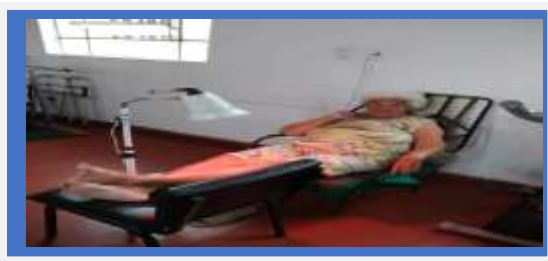
Fisioterapia 3x na semana

O número de idosos atendidos pela Fisioterapeuta diminuiu , pois, esteve de férias por 10 dias.