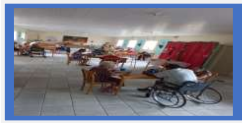
Dia: 13- Atividade Recreativa- Tarde festiva