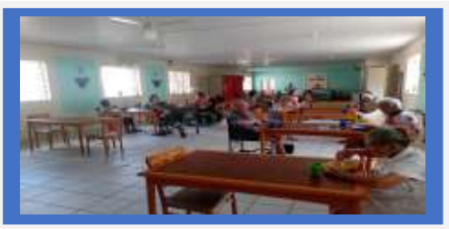
Dia:21 - Atividade Recreativa –Tarde festiva