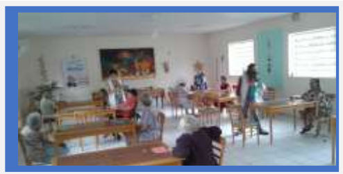
Dia :07- Atividade ludica: Jogo lúdico