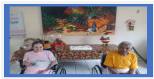
Dia: 30 –Atividade Cultural- Comemoração aniversariantes do mes