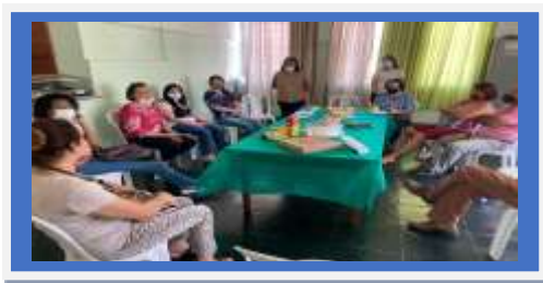
Dia:01 – Reunião CMDPI

OBJETIVO ESPECÍFICO: OPORTUNIZAR O ACESSO ÀS INFORMAÇÕES SOBRE DIREITOS E SOBRE A PARTICIPAÇÃO CIDADÃ, ESTIMULANDO O DESENVOLVIMENTO DO PROTAGONISMO DOS USUÁRIOS.