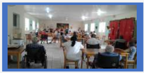
Dia:14 Atividade cultural- Apresentação Escola Musicando