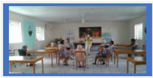
Dia: 08 - Roda de conversa

Observações: Os idosos estão tristes em função do isolamento social.