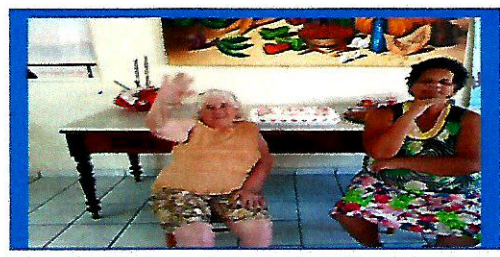
Dia: 30 – Atividade cultural Comemoração aniversariantes do mês