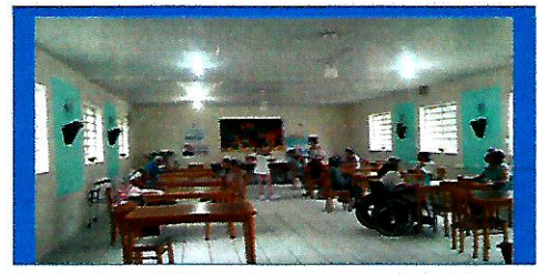
Dia:16 Atividade Lúdica Jogo lúdico