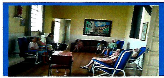
Idosas no salão social