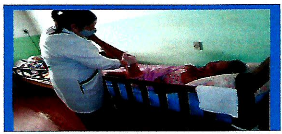
Fisioterapia 3x na semana