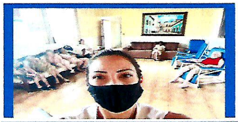
Dia: 14 Atividade lúdica