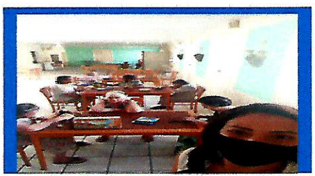
Dia: 29 –Oficina com a Psicóloga