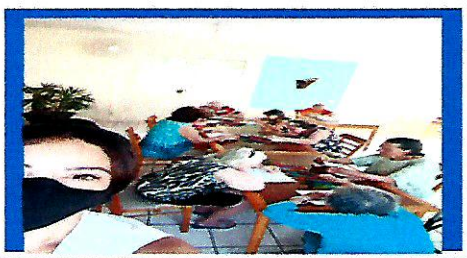
Dia:20 -Atividade Lúdica- Tema:Primavera