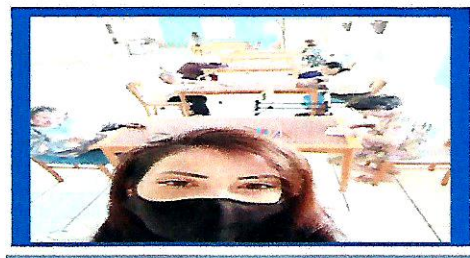
Dia: 22- Atividade Lúdica –Tema: Primavera