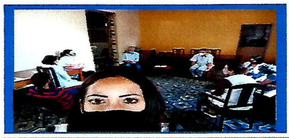
Dia: 08- Reunião da Equipe Técnica

OBJETIVO ESPECÍFICO: PROMOVER O ACESSO A PROGRAMAÇÕES CULTURAIS, DE LAZER, DE ESPORTE E OCUPACIONAIS INTERNAS E EXTERNAS, RELACIONANDO-AS A INTERESSES, VIVÊNCIAS, DESEJOS E POSSIBILIDADES DO PÚBLICO, BEM COMO A CONVIVÊNCIA MISTA ENTRE OS RESIDENTES DE DIVERSOS GRAUS DE DEPENDÊNCIA.