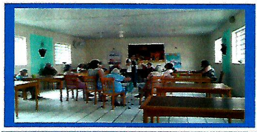
Dia: 27 - Roda de conversa

Observações: Os idosos estão tristes em função do isolamento social.