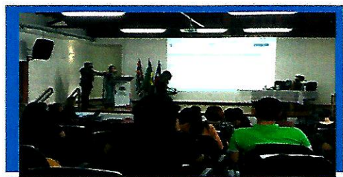
Dia:31- Conferencia Municipal de Assistencia Social

Observações: Utilize esse campo para informações que julgar necessário e não se encaixam nos itens anteriores.