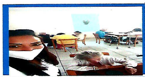
Dia:11 Atividade Lúdica Jogo de dominó e resta 1