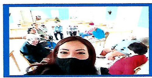
Dia:31- Oficina com a Psicóloga