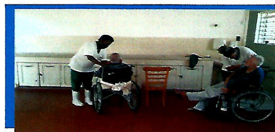
Idosos fazendo as barbas na OSC .