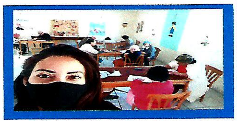
Dia: 04 Atividade lúdica – Olimpíada