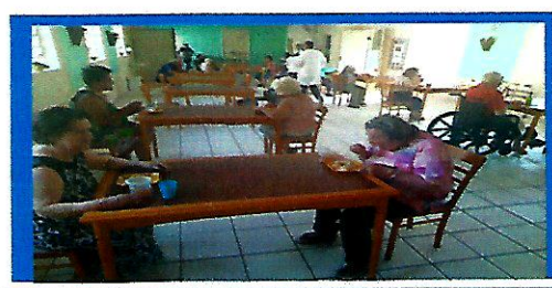
Dias: 16 e 28- Projeto Preservação da Identidade