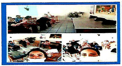
Dia: 18 Atividade Lúdica- Bola no cesto