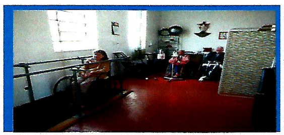
Fisioterapia 3x na semana

Dia: 04 - A idosa que seria acolhida, recusou a vaga. Aguardando resultados de exames para o acolhimento de uma idosa.