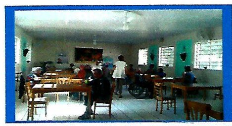
Dia: 24- Atividade Lúdica –Jogo lúdico