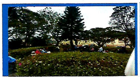
Dia: 08 –Festa temática- Dia dos Pais