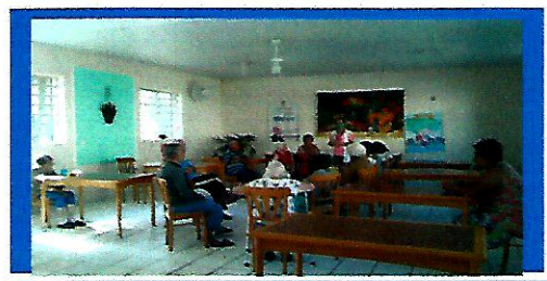
Dia: 23 - Roda de conversa

Observações: Os idosos estão tristes em função do isolamento social.