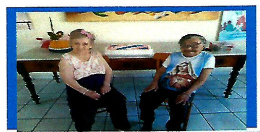
Dia: 26 – Atividade cultural Comemoração aniversariantes do mês