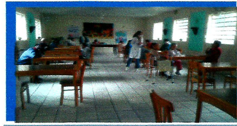
Dia: 20 Atividade Lúdica – Jogo lúdico