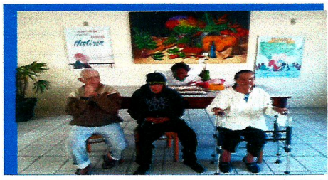
Dia: 26 Comemoração dos Aniverariantes