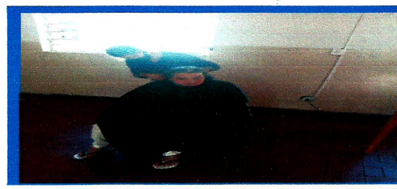
Corte de cabelo