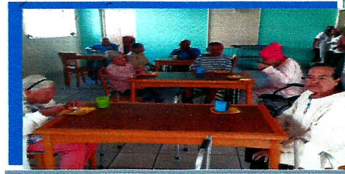
Dia: 09 Festa Temática – Dia das Mães