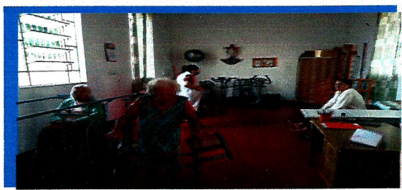
Fisioterapia 3x na semana

Dia: 01/06/2021- Será acolhido 01 idosa, não acolhemos no dia 31/05/2021, aguardando exame.