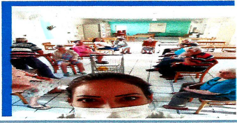
Dia: 05 Atividade lúdica- Jogo de basquete