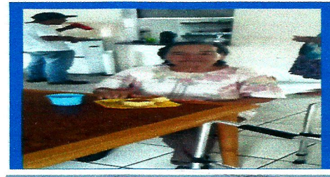
Dias: 02,05 e 15 Projeto Preservação da Identidade