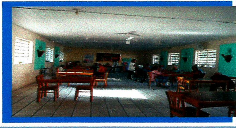
Dia: 13 Atividade Lúdica- Jogo lúdico