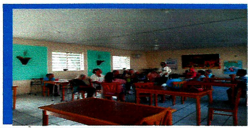
Dia: 21- Roda de conversa

Observações: Os idosos estão tristes em função do isolamento social.