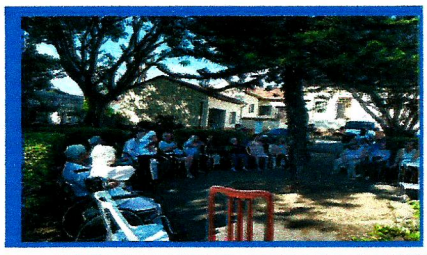
Dia: 28 Grupo de Convivencia -Tarde festiva