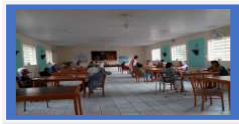
Dia:06 Atividade Lúdica Jogo Lúdico