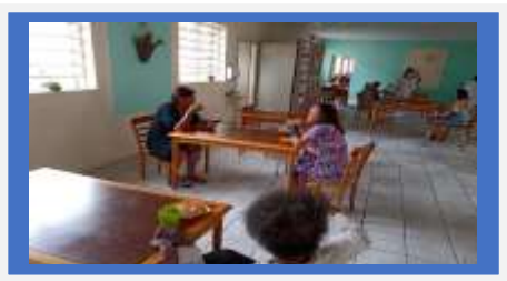
Dia: 16- Tarde Festiva Tarde da Pizza