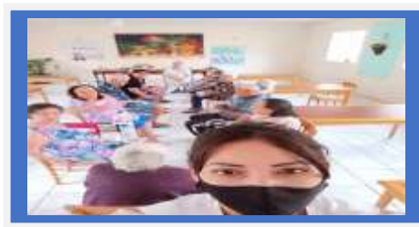
Dia: 15-Atividade Lúdica – Jogo do Passa Bexiga