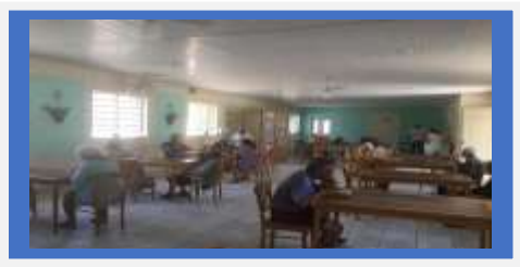
Dia: 04- Festa Temática- Almoço Comemoração da Páscoa