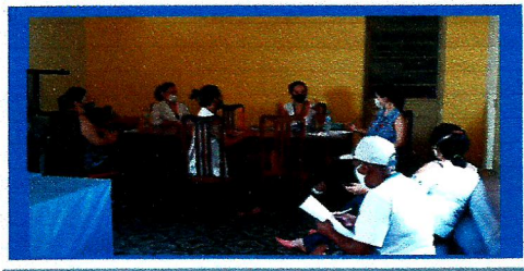
Dia: 29 Reunião Equipe Técnica

OBJETIVO ESPECÍFICO: PROMOVER O ACESSO A PROGRAMAÇÕES CULTURAIS, DE LAZER, DE ESPORTE E OCUPACIONAIS INTERNAS E EXTERNAS, RELACIONANDO-AS A INTERESSES, VIVÊNCIAS, DESEJOS E POSSIBILIDADES DO PÚBLICO, BEM COMO A CONVIVÊNCIA MISTA ENTRE OS RESIDENTES DE DIVERSOS GRAUS DE DEPENDÊNCIA.