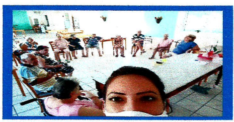
Dia: 17 Atividade Lúdica Reconhecimento de objetos