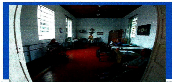
Fisioterapia 3x na semana