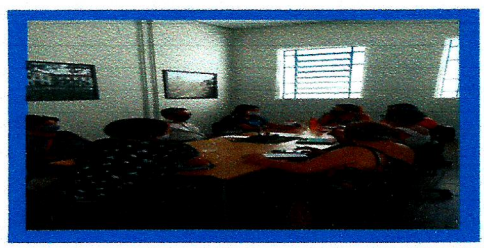
Dia: 03- Reunião CMDPI

Observações: utilize esse campo para informações que julgar necessário e não se encaixam nos itens anteriores.