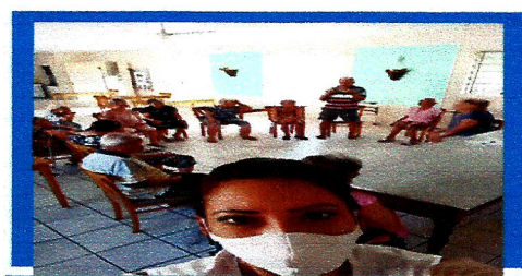
Dia: 11 Atividade Lúdica-Roda de leitura