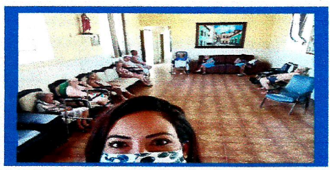
Dia: 09 Atividade Cultural-Reunião com os idosos