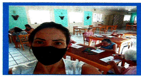
Dia: 24 Oficina com a psicóloga -Tema: Outono