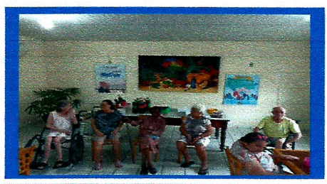
Dia: 31- Atividade cultural aniversariantes do mês