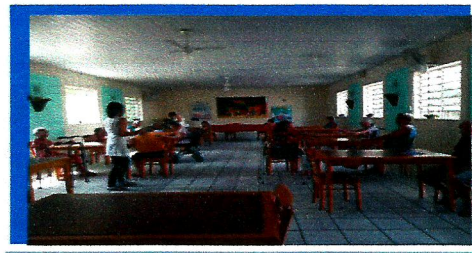
Dia: 04- Jogo lúdico