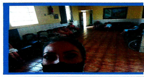
Dia: 11 – Atividade Cultural Reunião com os idosos