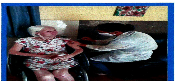
Dia: 17 Funcionários e Idosos sendo vacinados 2ª dose