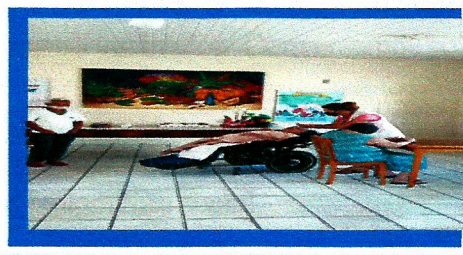
Dia: 24- Atividade cultural aniversariantes do mês