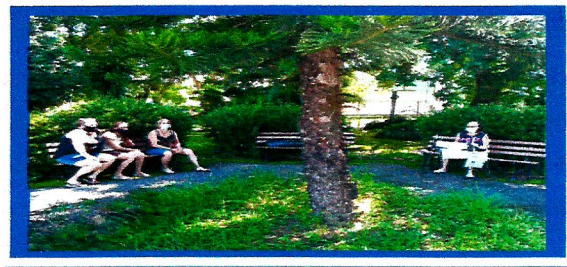
Visita de familiares ao idoso

Aguardando exames e documentos para acolhimento de 03 idosos.