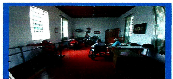
Fisioterapia 3x na semana