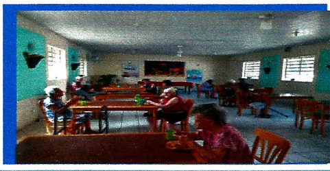
Dia: 18 Atividade Festiva Lanche festivo