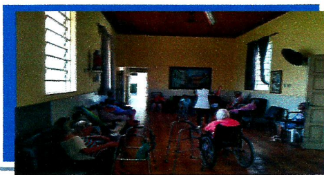
Dia:10 Atividade Lúdica Jogo de Basquete