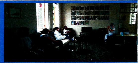
Dia: 26- Capacitação para os Técnicos de Enfermagem

OBJETIVO ESPECÍFICO: PROMOVER O ACESSO A PROGRAMAÇÕES CULTURAIS, DE LAZER, DE ESPORTE E OCUPACIONAIS INTERNAS E EXTERNAS, RELACIONANDO-AS A INTERESSES, VIVÊNCIAS, DESEJOS E POSSIBILIDADES DO PÚBLICO, BEM COMO A CONVIVÊNCIA MISTA ENTRE OS RESIDENTES DE DIVERSOS GRAUS DE DEPENDÊNCIA.