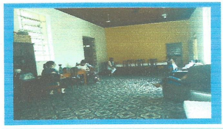
Dia: 30 - Reunião Equipe Técnica

CREAS Centro de Referência Socializado de Assistência Social Tel.: (12) 3132-8114