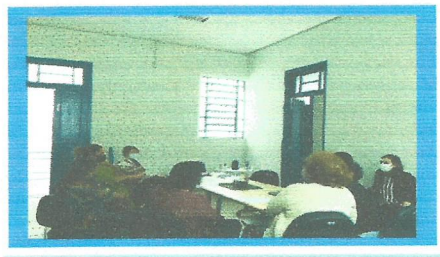
Dia: 04 Reunião CMDPI