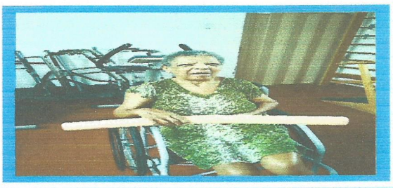
Atividade Fisioterapia 3x na semana

Observações: Complexidade frente aos acolhimentos de idosos em função do COVID-19.