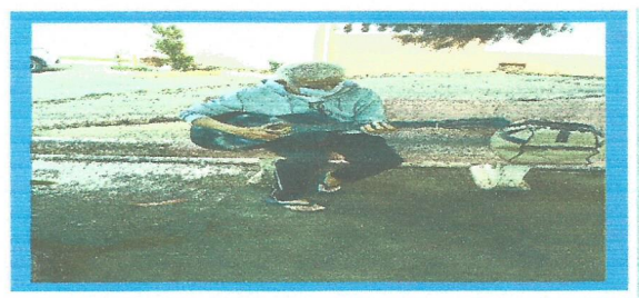
Dia: 10–Idoso tocando violão em momento de lazer.

CREAS Centro de Referência Especializado de Assistência Social Tel.: (12) 3132-4919