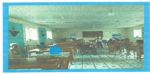
Dia: 13- Roda de conversa