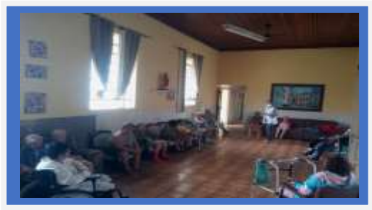
RODA DE CONVERSA DIA: 17 COORDENADA PELA ASS. SOCIAL