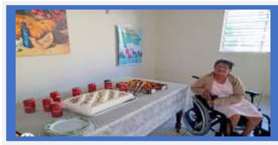
ANIVERSARIANTES DO MÊS DIA 29