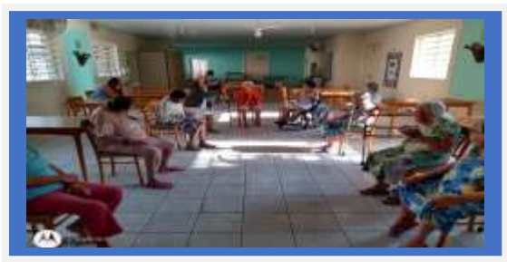
JOGO DE BAMBOLÊ DIA 22