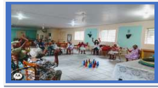
JOGO DE BOLICHE DIA 15