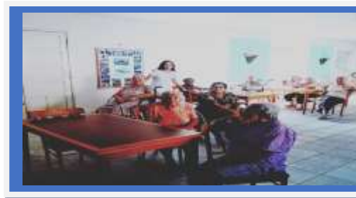
ATIVIDADE LÚDICA DIA 9 COORDENADA PELA PSICÓLOGA