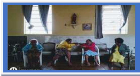
PASSA ARGOLAS - DIA