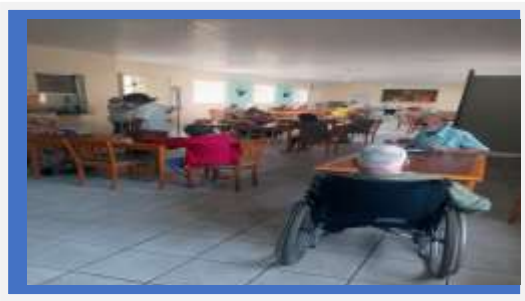
TARDE DA PIZZA – DIA 8

Grupo de convivência Atividade Cultural Dia: 29- Comemoração dos aniversariantes do mês- Na última quarta-feira do mês, no horário do café, comemoramos os aniversariantes do mês, são convidados a sentarem-se à mesa central onde é colocado o bolo e cantado os parabéns.