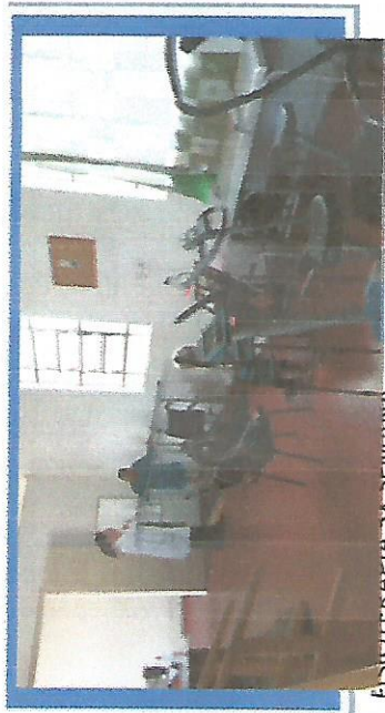
FISIOTERAPIA DA SEMANA