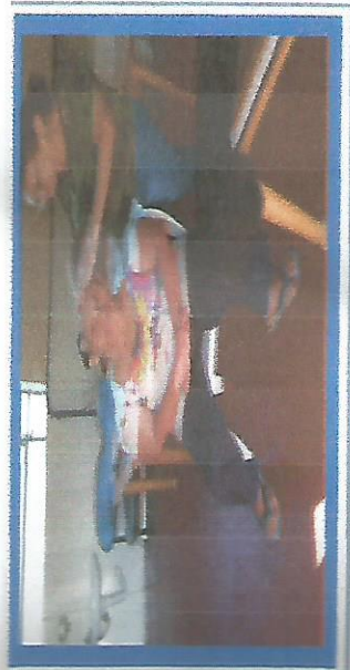
DIA DA BELEZA