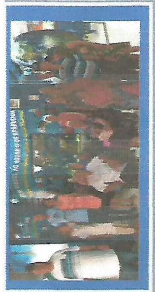
PASSEIO AQUÁRIO DIA 21