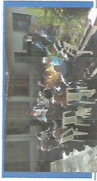
RODA DE CONVERSA DIA 29