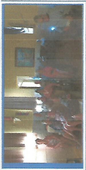
CINEMA DIAS 16,23,30