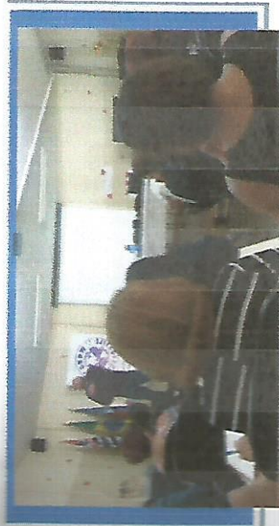
CAPACITAÇÃO PARA OS CONSELHEIROS