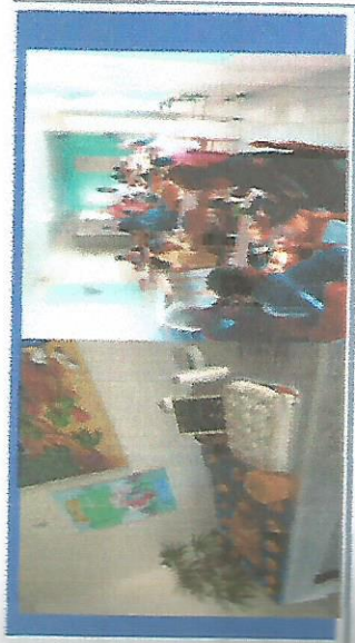
ANIVERSARIANTE DO MÊS DIA 29