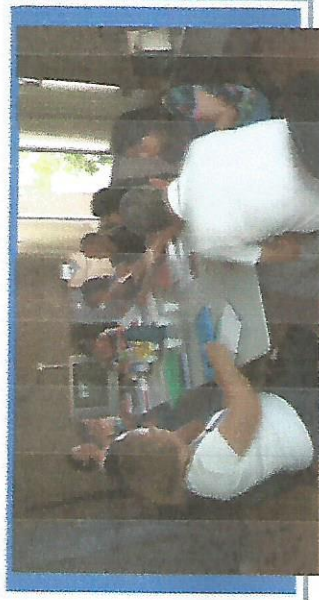
REUNIÃO CMDPI DIA 08