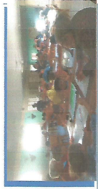
CRECHE CHICO XAVIER DIA 29