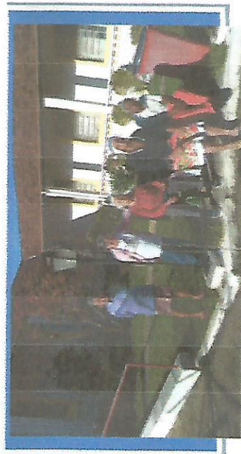
IDOSOS NO PÁTIO EXTERNO DA OSC