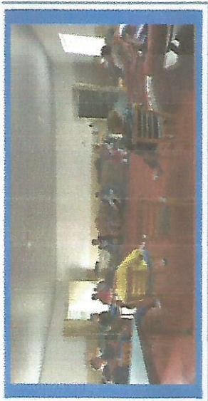
ATIVIDADE FÍSICA DIA 15