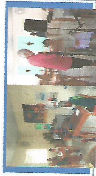
FESTA TEMÁTICA DIA DAS MÃES DIA 05