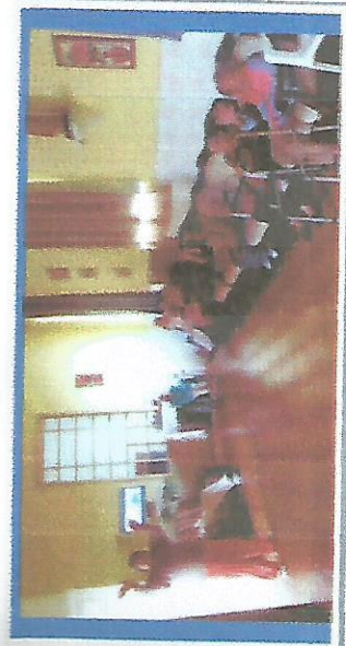
ATIVIDADE LÚDICA DIA 30