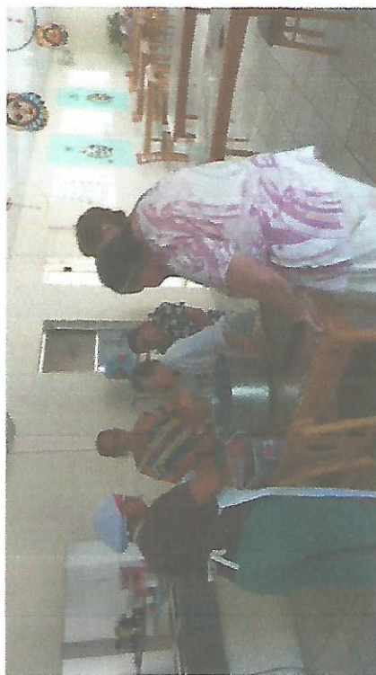
COLAÇÃO SERVIDO AS 10H