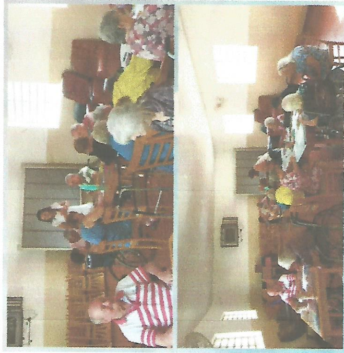
ATIVIDADE LÚDICA – DIA 26