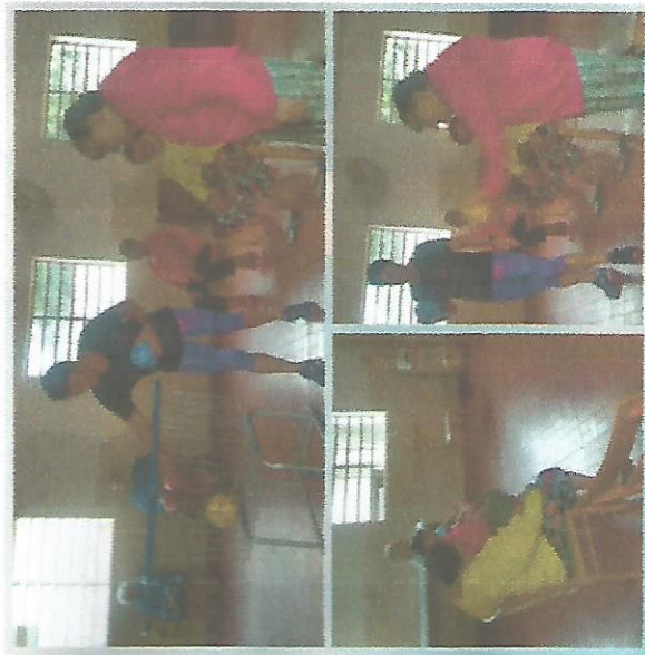
ATIVIDADE FÍSICA - DIA 13

RMIANDADE SANTA ISABEL CASA DE REPOUSO SANTA ISABEL Rua Tamandaré, nº 451 – Centro Guaratinguetá – SP - CEP 12503-000 Tel: (12) 31328114 CNPJ 48.545.594/0001-42