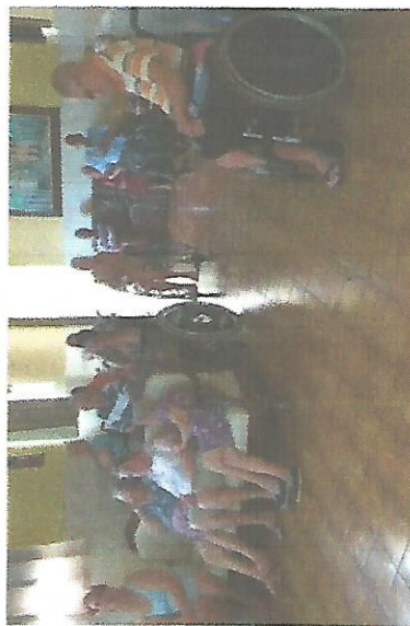
ATIVIDADE CINEMA DIAS 14, 21 E 28