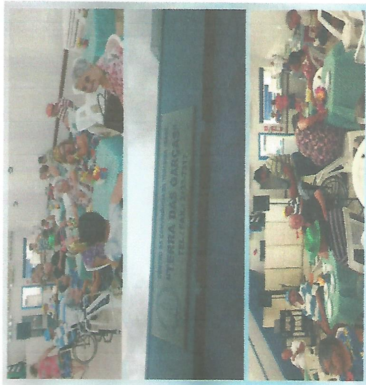
PASSEIO EXTERNO – ENCONTRO GERACIONAL – DIA 20

RMANDADE SANTA ISABEL CASA DE REPOUSO SANTA ISABEL Rua Tamararé, nº 451 – Centro Guaratinguetá – SP - CEP 12503-000 Tel: (12) 31328114 CNPJ 48.545.594/0001-42