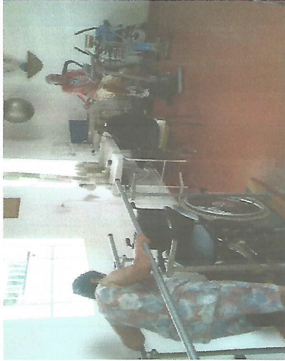
ATENDIMENTO DE FISIOTERAPIA – 3X SEMANA