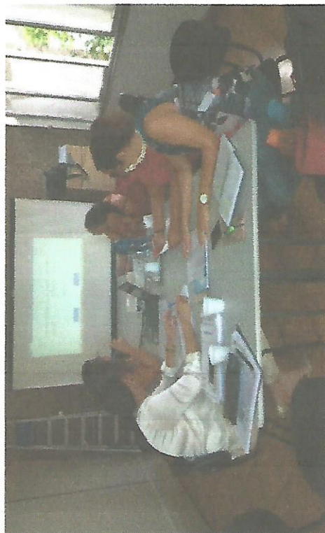
REUNIÃO OSC-PROTEÇÃO SOCIAL ESPECIAL DE ALTA COMPLEXIDADE-IDOSOS