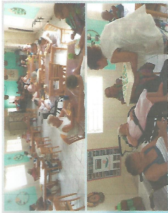
ANIVERSARIANTES DO MÊS – DIA 27

IRMANDADE SANTA ISABEL CASA DE REPOUSO SANTA ISABEL Rua Tamararé, nº 451 – Centro Guaratinguetá – SP - CEP 12503-000 Tel: (12) 31328114 CNPJ 48.545.594/0001-42