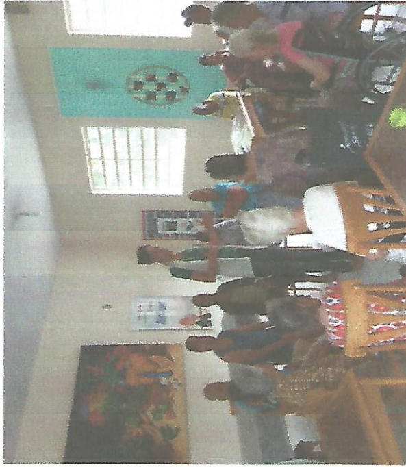
RODA DE CONVERSA - DIA 15